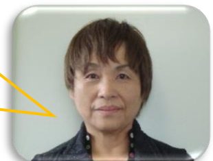
希望塾速水施設長

利用者の特性に応じ惣菜班、加工班、農耕班に分かれての作業。惣菜はいくつかのヒット商品を生み、加工も地域の農家さんに協力を得ています。農耕は、生活介護とコラボし新しい農業形態を模索しております。利用者さんも楽しく仕事に励んでいます。