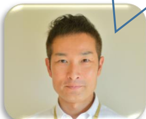
海上アルファー工房 林施設長

大好きなことは、食べる事とドライブで、外食を楽しみにしています。かと言って食べる事だけでなく、パッカーの受注が入るとせっせと作業に取り組んでいます。皆さん仲が良く、動けないでいる方を見ると優しく背中を押してくれる。そんな利用者さん同士の関わり合いが見られます。